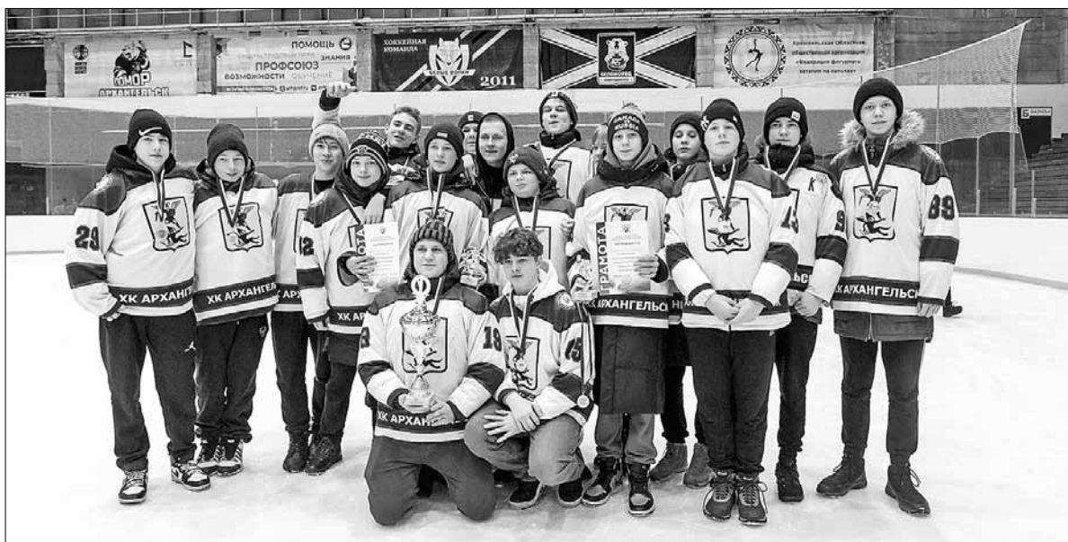
■ ФОТО: МИНИСТЕРСТВО СПОРТА АРХАНГЕЛЬСКОЙ ОБЛАСТИ

Столицу Поморья представляли две команды – «Архангельск» и «Белые медведи». Честь Северодвинска защищал «Беломорец – ДЮСШ-1». Устьянский округ представляла ледовая дружина «УЛК»