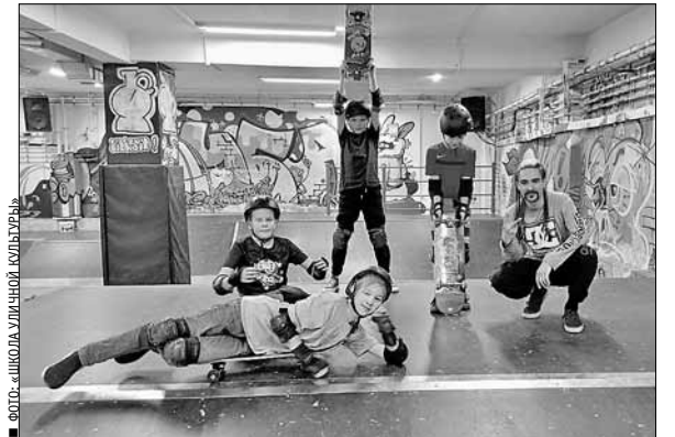
■ ФОТО: ШКОЛА УЛИЧНОЙ КУЛЬТУРЫ

Проект реализуется при поддержке Благотворительного фонда Владимира Потанина и министерства по делам молодежи и спорта Архангельской области. Записаться на занятия в Школу уличной культуры можно по телефону: 8 (900) 914-22-14.