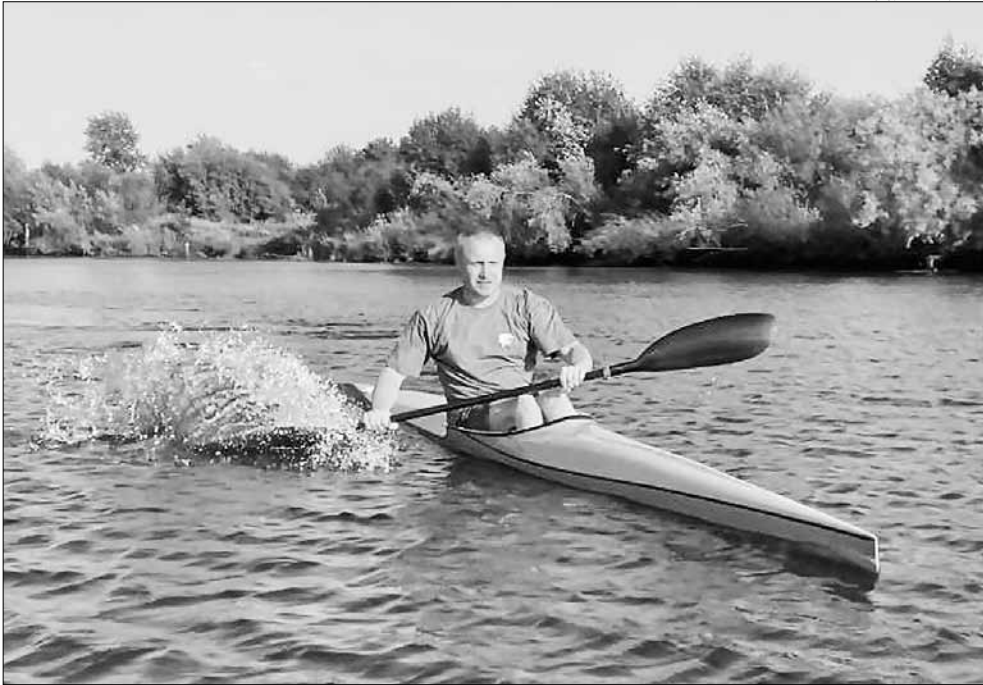
■ ФОТО: ИВАН МАЛЫГИН

Наверняка этому есть научное обоснование, но по-